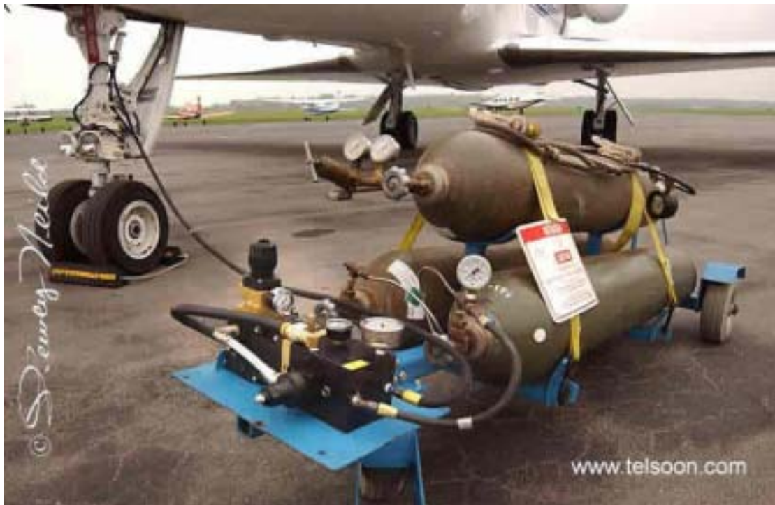
美国航空充氮泵机场应用案例