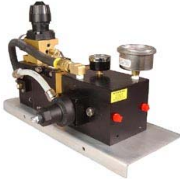
美国航空充氮泵外形图

注： 1MPa = 145Psi 1Mpa=10Bar 1scfm = 28 公升/分钟