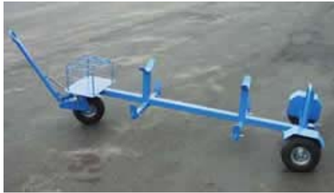
机场专用小车，来装载气瓶和充氮泵