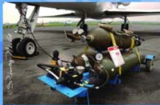
美国机场应用案例